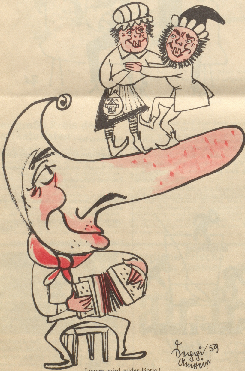
Luzern wird wider läbtig!

— — — dieweil sie mit Geräusch verbunden!