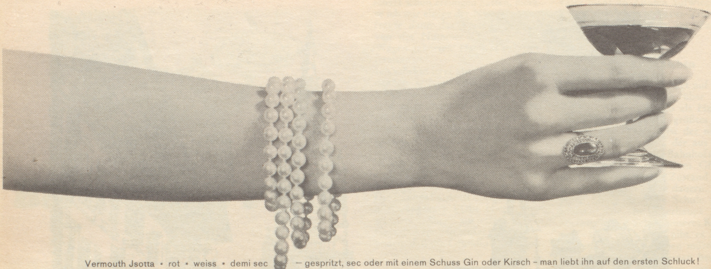
Vermouth Jsotta • rot • weiss • demi sec — gespritzt, sec oder mit einem Schuss Gin oder Kirsch — man liebt ihn auf den ersten Schluck!