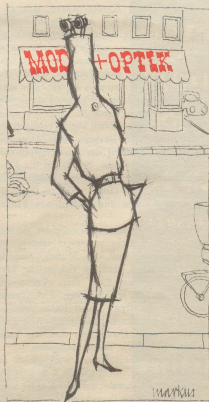
Die Hohekragenmode bedingt Scherenfernrohr

Daß manche Leute gedankenlose und geschmacklose Bemerkungen machen, ist leider eine Tatsache, aber daß eine Zeitung von