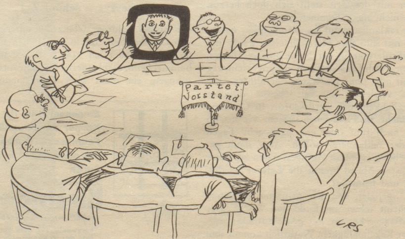
Der Mann, der im Fernsehen zu den Schweizer Frauen sprechen soll, wird in sorgfältiger Wahl ausgesucht.

Die Situation ist wohlbekannt. Man ist an einer wichtigen Arbeit und dann läutet die Hausglocke. So erging es mir eines Vormittags. Ich war eben daran die Wärme des Schoppens für die Jüngste zu prüfen - da: brrrrrrr! Schnell die Flasche ins kalte Wasserbad stellen und dann an die Haustüre eilen. Ein junger Herr erklärt mir wortreich eine umfassende Umfrage unter allen Hausfrauen über Haushaltmaschinen. Mit einem Ohr höre ich den Wortschwall und gewissermaßen mit dem anderen Ohr meinen Filius Küchenhocker schieben und sonstige verdächtige Geräusche. Also mache ich kurzen Prozeß. Auf meine Frage, welche Firma er eigentlich verrete, antwortet der junge Mann prompt: