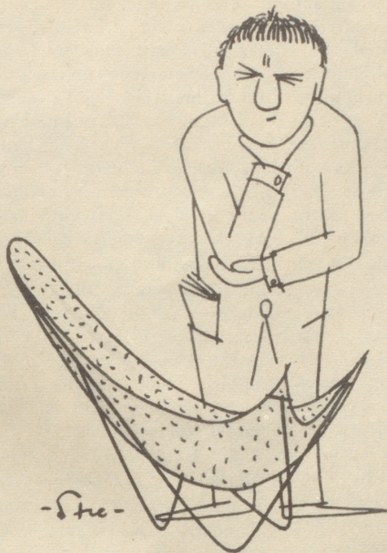
Wohnberater X. Bombaron schuf den Stuhl der neuen Richtung,