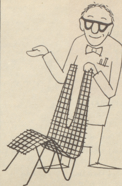
Innenarchitekt Dr. Y. Chrtniply schuf den Stuhl der Form im Raum,