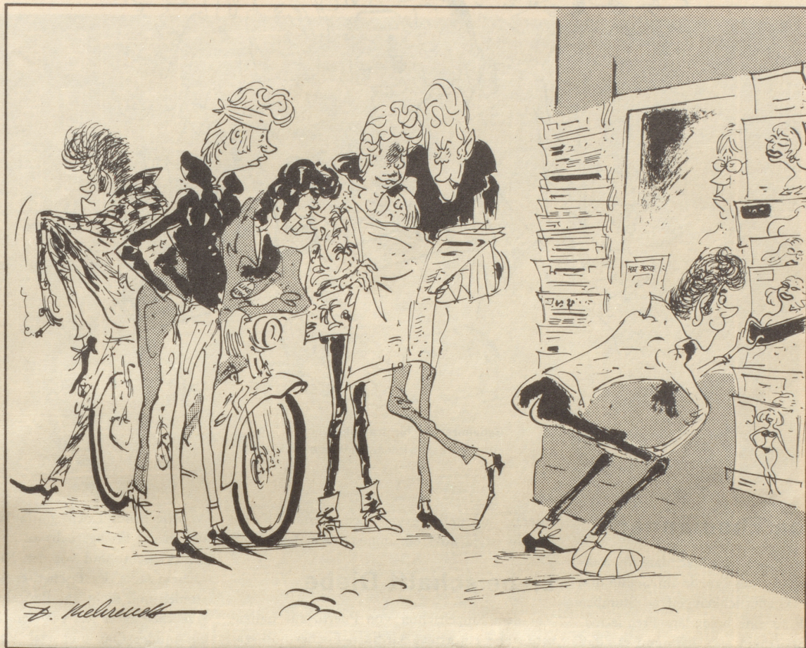
« Was schriibez i de Gazettli hüt über eus? »