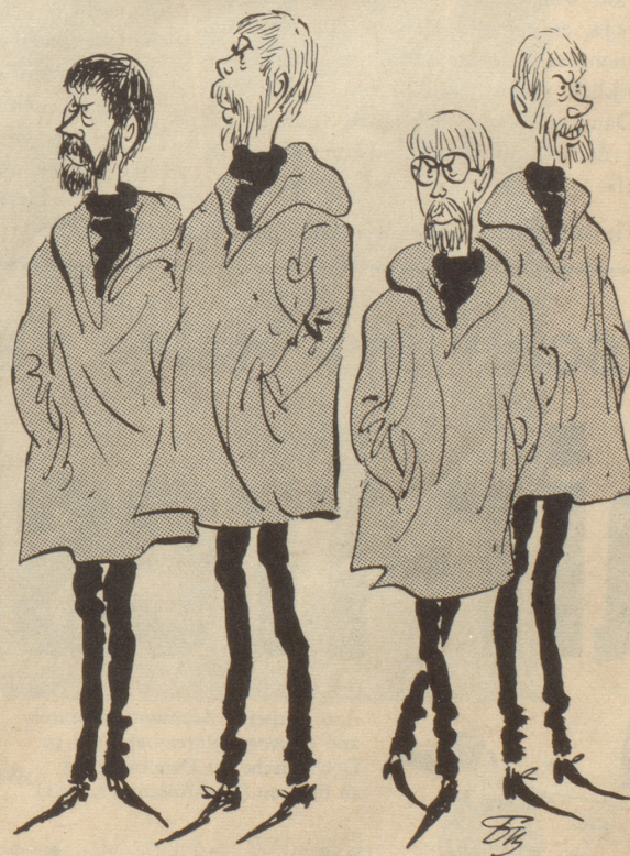
« Me mues nu luege wie s aagleit sind die Chliibürger: Ein wie dr ander! »