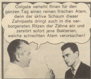
SPÄTER — dank Colgate: