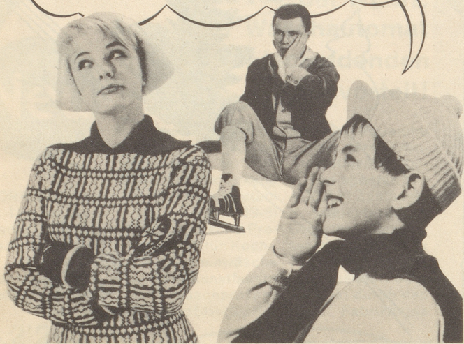
Was Peter erfuhr!