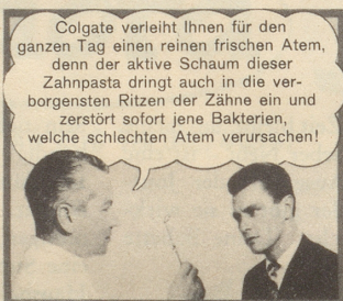
SPÄTER — dank Colgate: