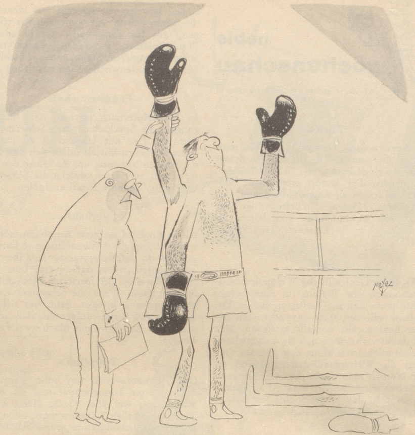
Zum Weltmeister prädestiniert!