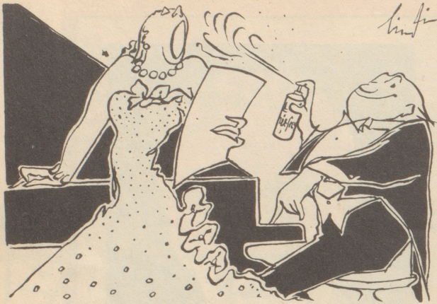
in C-Dur singt sie schön und fein mit air-fresh bleibt die Luft so rein