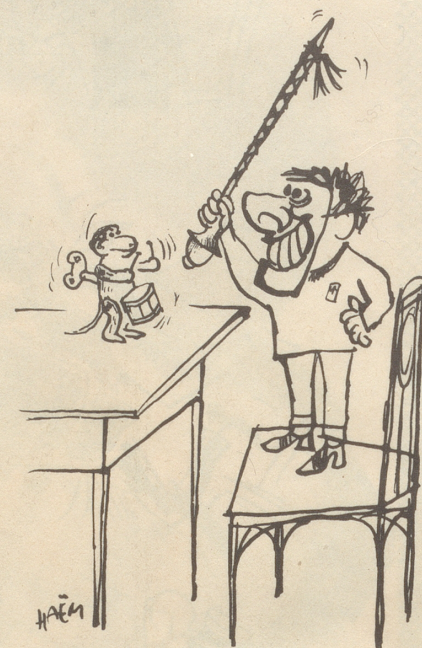
Der Tag vor dem Morgenstreich

«So, so», staunt Bobby. «Und wie hieß die Stadt vor dem Erdbeben?» *