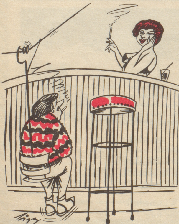
Der Barlift Dienst am Kunden

So, und jetzt werde ich die zu kurze Nestel meiner Schuhe zunesteln. Mög die Nestelschnur heute ausreichen! Und mir gnädig sein!