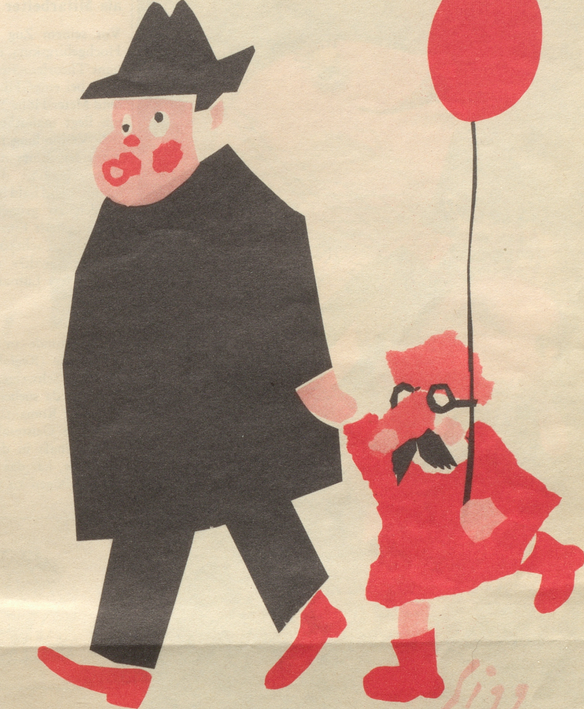
Vater und Sohn an der Fasnacht

In der ulkigen Berner Sendung «Wenn sie nur Worte haben» fiel zwischen Sprichwörtlichem und Zitätlichkeiten der nette Satz: «Stets kann man sich auf Goethe berufen wie auf einen Allerwelts-Papi ...» Ohohr