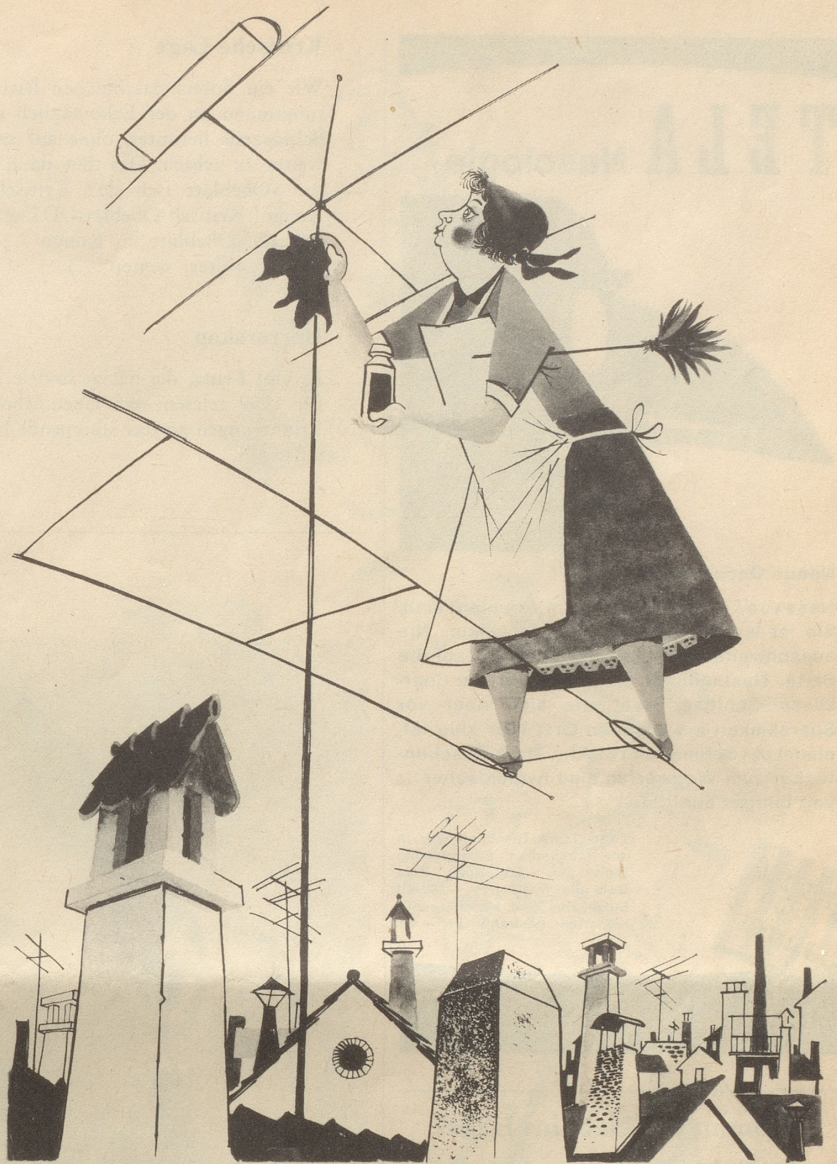
Die wackere Hausfrau

Wer weiß, aus was dieser Gummi besteht, denkt der Vorsichtige, steckt den Finger in den Mund und benetzt damit den Rand des Briefumschlages ... Boris