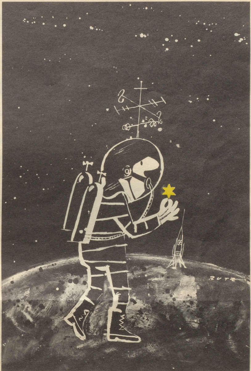
Weltraumfahrer bringt Souvenir nach Hause

«Du, Karl, wänn wämmer dänn hüürate?» «Muesch na e chli warte, Liebs: Sobald dLäbeschoschte abegönd ...» bi