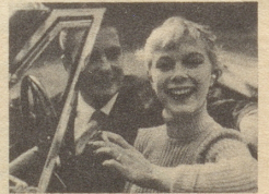
Autofahren lernen ein Vergnügen

«Ich halte an. Stelle den Motor ab. Ziehe die Handbremse. Las- se bei Nacht die Posi- tionslichter brennen.» «Gut», sagte der Fahrlehrer und fragte: «Und wenn Sie wieder abfahren wol- len?»