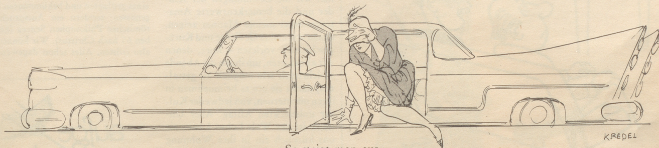
So steigt man aus