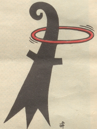
Gruß aus Basel