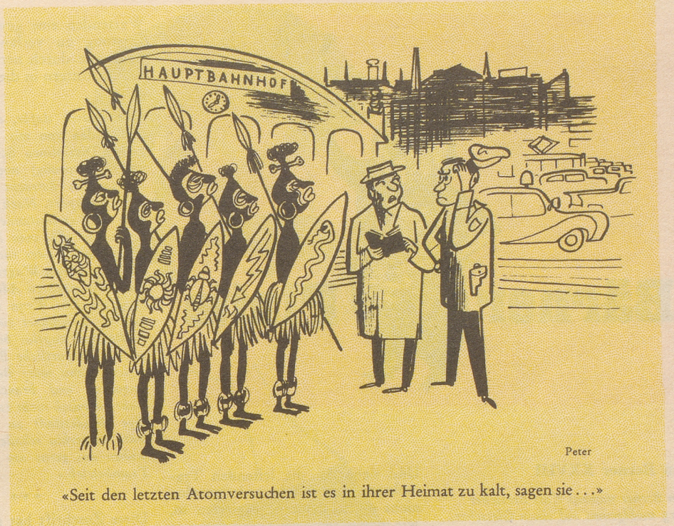
«Seit den letzten Atomversuchen ist es in ihrer Heimat zu kalt, sagen sie ...»