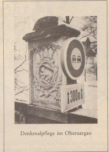
Denkmalpflege im Oberaargau

sendet (mit dem Vermerk auf der Rückseite des Postabschnittes: Für die Osteuropa-Bibliothek), bekundet seinen wachen Sinn für die Notwendigkeit der Abwehr der kommunistischen Gefahr.