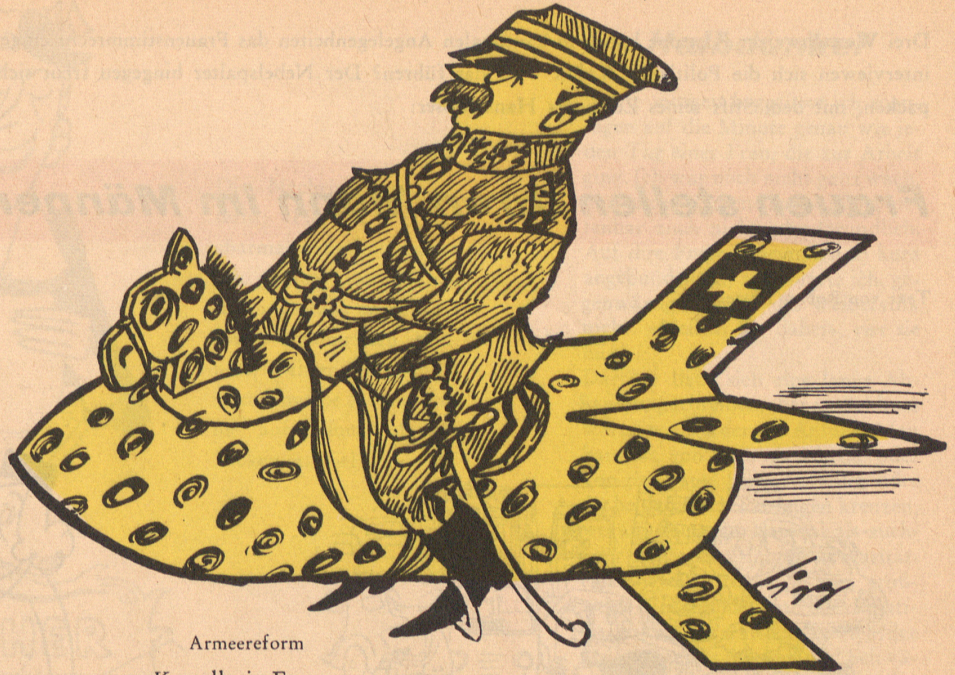
Armee reform Kavallerie-Ersatz

Ein Raketenbummler mit Begleiterin hält vor dem Polizisten auf der Weltraumverkehrsinsel: «Wie weit ist es noch zur Milchstraße?» – «Nicht mehr weit. Immer geradeaus bis zum Mars, dann links bis zum Saturn, und in 154 Lichtjahren sind Sie dort.» bi