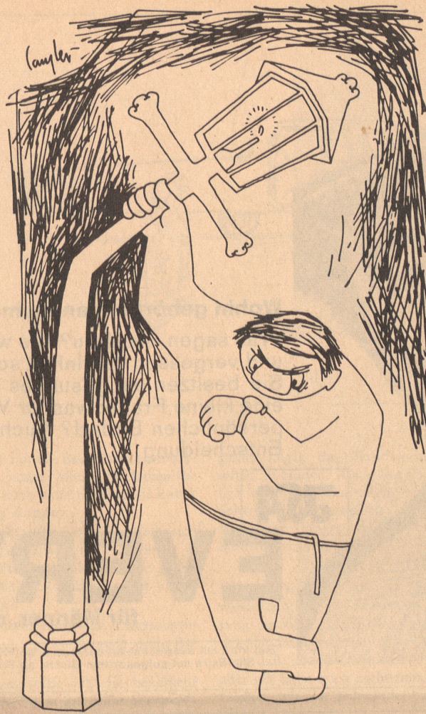
Schon so spät!

wenn einer rechtzeitig und bei klarem Verstand damit beginnt. Sonst sind es doppelt so viel. Seit Menschengedenken und wohl noch eine Spanne weiter zurück muß in diesen Gemeinden jeder Neugewählte eine Zinnkanne stiften, sei er Präsident geworden, Rats Herr oder Vizerichter oder auch bloß Wald- und Flurhüter. Und wird einer als Großrat erkoren, ist das eine Doppelkanne wert. Die ganze Gemeinde zieht ehrfürchtig daran vorbei und netzt die Lippen. Wahljahre sind dem Kannengießer sympathisch. Als unpolitischer Kannengießer ist er eine ehrliche Haut. Für jede Kanne, werde sie von einem Schwarzen oder Gelben bezahlt, verwendet er das gleiche silberweiße und echtlötlige Zinn. Wer