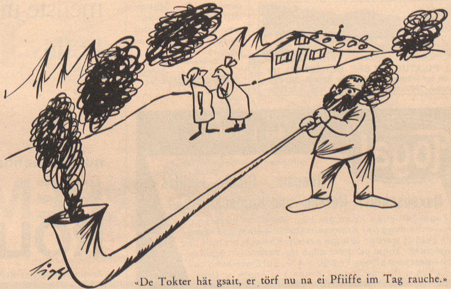
«De Tokter hät gsait, er törf nu na ei Pfiiffe im Tag rauche.»