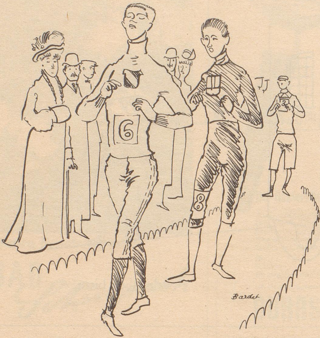
Der Dauerlauf in den städtischen Anlagen