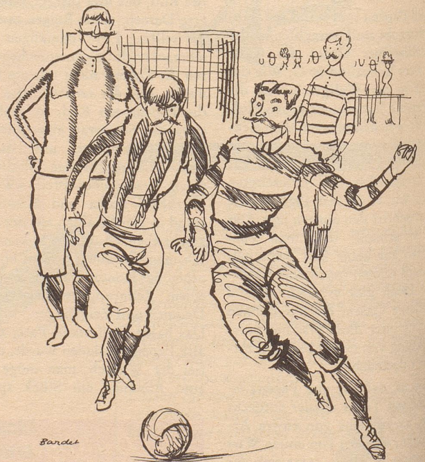
Das erste braune Leder