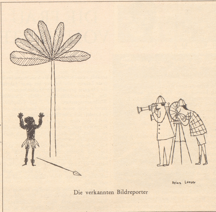
Die verkannten Bildreporter