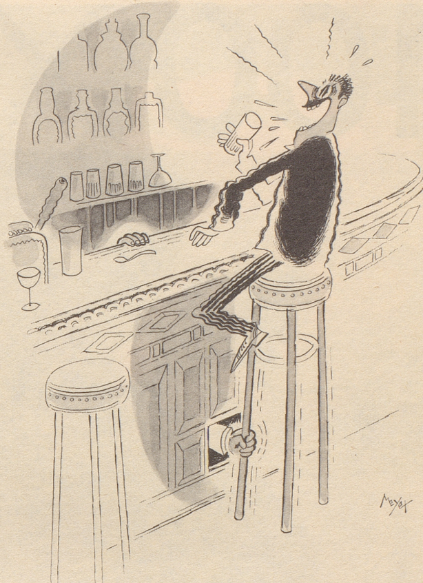
Der letzte zähe Gast

erhob sich der Löwenherz. Zeit, Komplize, befahl er.