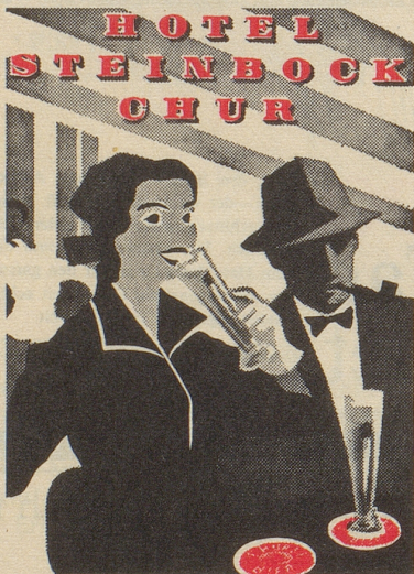
Das Boulevard-Restaurant in Chur

Wert Fr. 9455.—, sowie 9337 weitere lockende Vorzugstreffer.