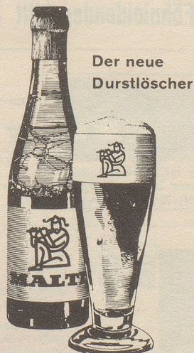
Der neue Durstlöcher

MALTI ist das erste und einzige im Dual-Verfahren aus Hopfen und Malz gebraute Bier – alkoholfrei und doch rassig.