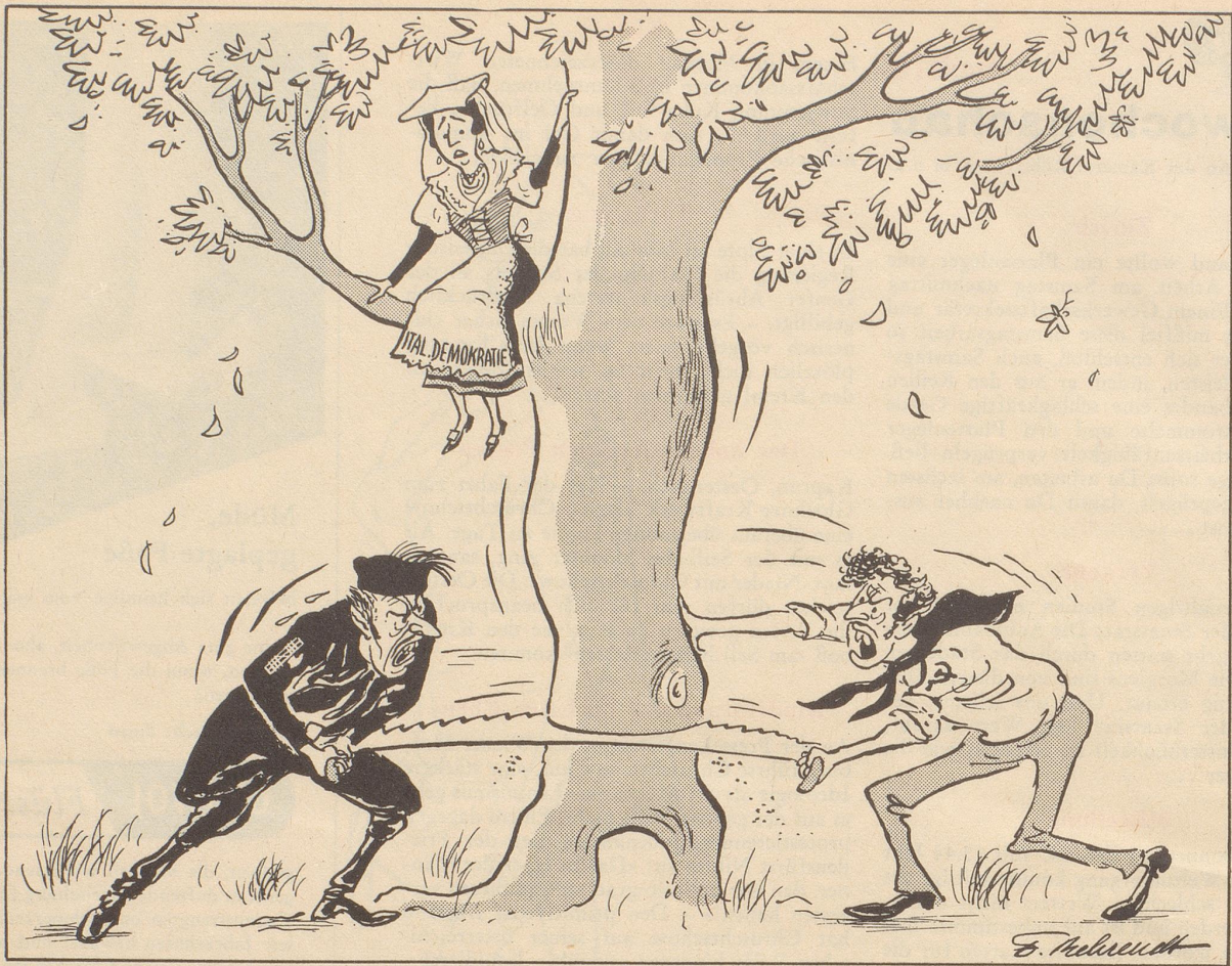
Mit vereinten Kräften...