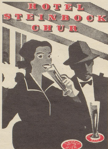
Das Boulevard-Restaurant in Chur

Packungen zu Fr. 5.50, 8.40. Sehr vorteilhafte Kurpackung 14.20. In Apotheken und Drogerien Nur Reinlecithin Dr. Buer sichert Lecithin-Erfolge