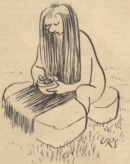
Die erste Tischdecke

Aus dem großen Eßtisch läßt sich mit ein paar Griffen ein bequemes Doppelbett herstellen. Der Kaffeetisch ergibt ein Einerbett. Das Sofa ergibt ein weiteres, und an die Fauteuils kann eine Verlängerung angebracht werden, und schon haben wir wieder ein Bett. Der Rest der Betten wird aus der Wand