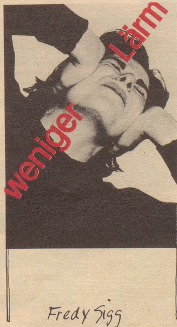
Der zweitälteste Lärm