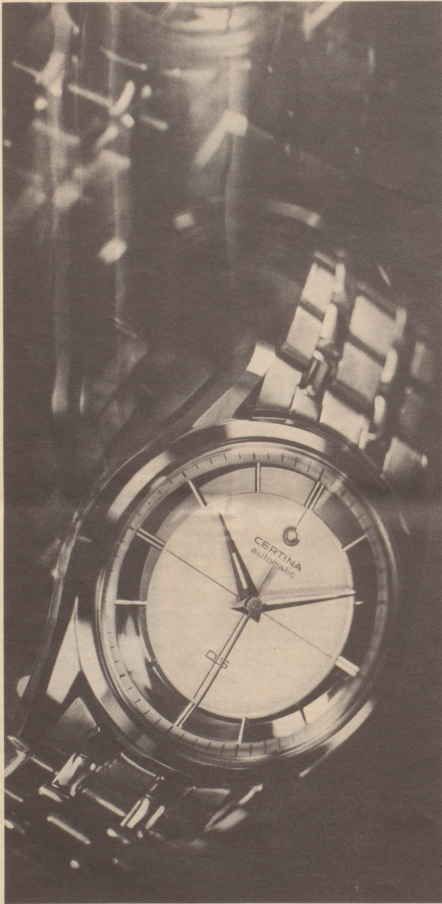
CERTINA Kurth Frères S.A. Grenchen/ISO