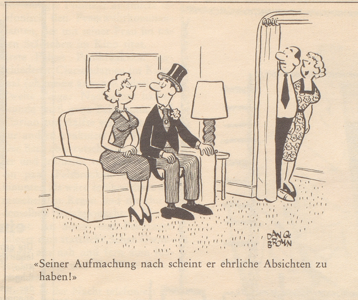
«Seiner Aufmachung nach scheint er ehrliche Absichten zu haben!»

Selbst wenn dieses Grundstück vielleicht früher von lästigen Picknikern und ihren Abfällen übersät war, ist die Art Ansporn zur Angerei von seiten einer helvetischen Gemeinde höchst widerlich. Was wetten wir – im besagten Ge-