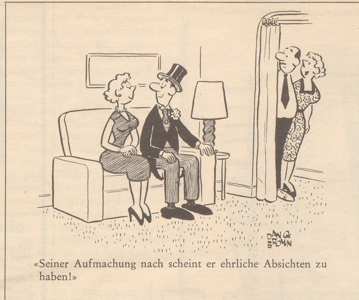
«Seiner Aufmachung nach scheint er ehrliche Absichten zu haben!»

Selbst wenn dieses Grundstück vielleicht früher von lästigen Picknikern und ihren Abfällen übersät war, ist die Art Ansporn zur Angerei von seiten einer helvetischen Gemeinde höchst widerlich. Was wetten wir – im besagten Ge-