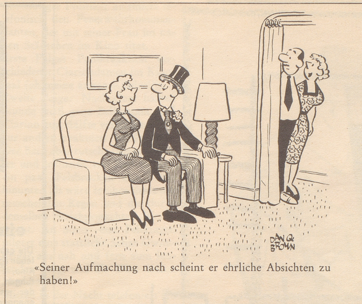
«Seiner Aufmachung nach scheint er ehrliche Absichten zu haben!»

Selbst wenn dieses Grundstück vielleicht früher von lästigen Picknikern und ihren Abfällen übersät war, ist die Art Ansporn zur Angerei von seiten einer helvetischen Gemeinde höchst widerlich. Was wetten wir – im besagten Ge-