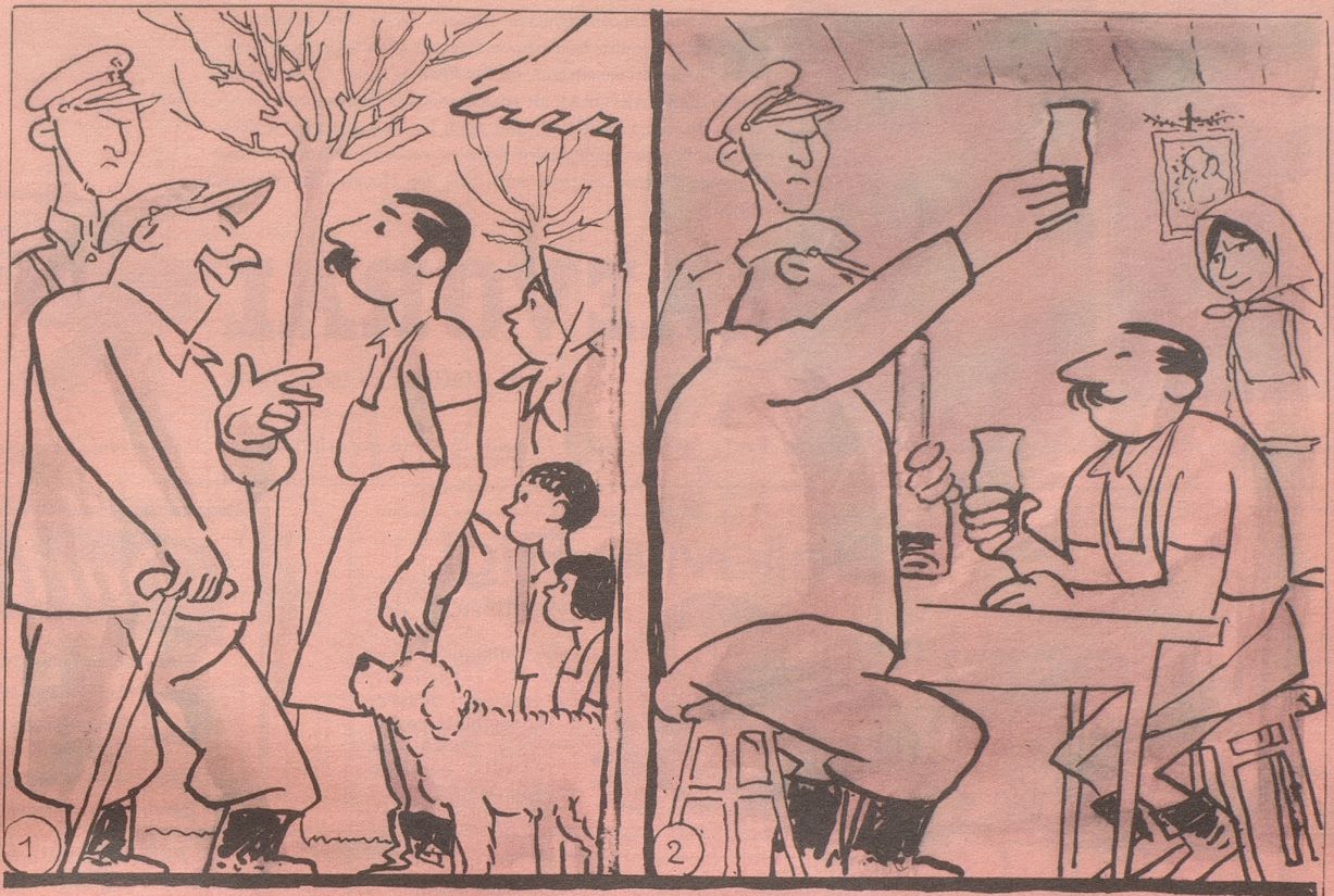
Komm in die Kolchose Genosse