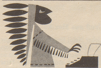
...ich, der "Grosse Bär", Häuptling der tapfern...*

In einer Gesellschaft wurde die Frage gestellt, welches der älteste Beruf sei. «Selbstverständlich Chirurg», sagte ein Dozent an der Universität. «Als der Herrgott die Frau schuf, nahm er Adam eine Rippe weg. Dazu war ein chirurgischer Eingriff notwendig.» «Sie entschuldigen», erklärte ein Architekt, «aber vorher herrschte ein Chaos und um die Welt aufzubauen, brauchte man einen Architekt.» «Und das Chaos?» fragte ein Anwesender, «hat das vielleicht ein Polizist erschaffen?» ka