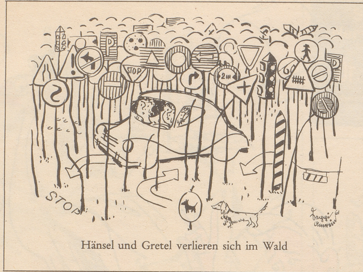
Hänsel und Gretel verlieren sich im Wald

Im Joor nüünzähahundartachtuffzig hätt dar Bund beschlossa, as törfandi khai nöüji Rääba mee applanzt wärda. Um dää Beschlüß hend sich natüürl dia Wiipuura vu Saxon-Saillon khai Dräckh khüm-