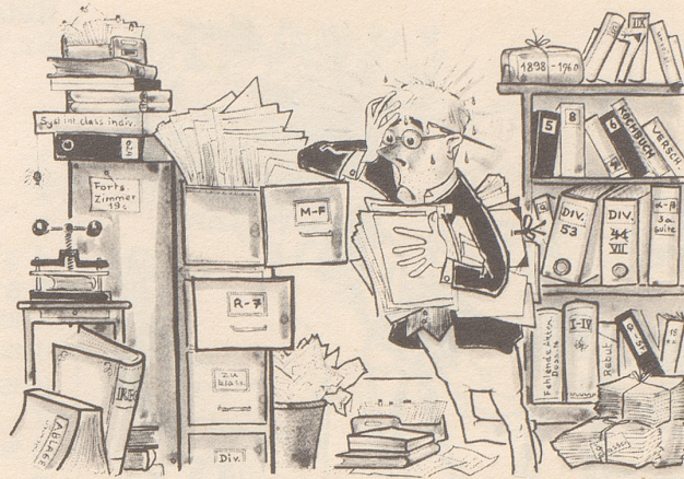
«Wenn i wüßt was i such so wüßti wos ischt.»

EFTA-Gebiet vorstoßen. Es ist daher in Mittel-EFTA mit böigen Winden und Niederschlägen zu rechnen, während das östliche EFTA-Gebiet mit zeitweisen Aufhellungen rechnen kann. Eine vorübergehende Aufheiterung verbunden mit Druckanstieg im zentralen Commonwealth-Raum vermag zwar die EWG-Randgebiete zu erreichen, dürfte jedoch die Gesamtwetterlage bei der EFTA nicht nachhaltig beeinflussen.»