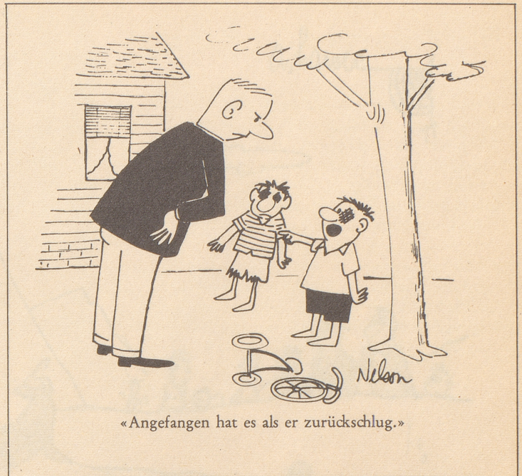
«Angefangen hat es als er zurückschlug.»

Feuer breitet sich nicht aus, hast Du MINIMAX im Haus!