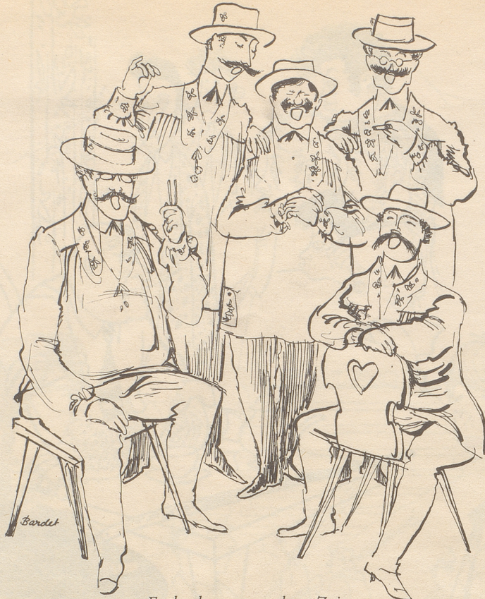
Ende der guten alten Zeit Die ersten jodelnden Städter