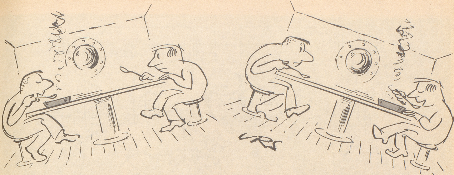
Mahlzeit auf hoher See oder von den Launen des Schicksals