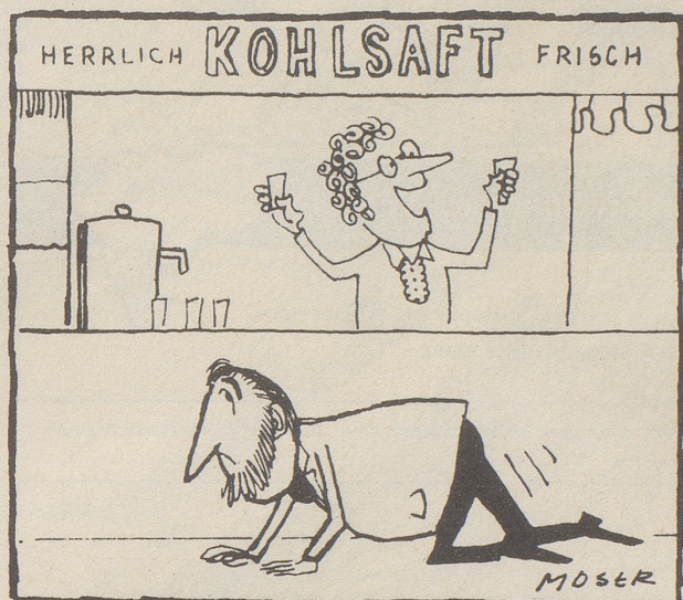
Albert jr. erlebte diese Woche ---