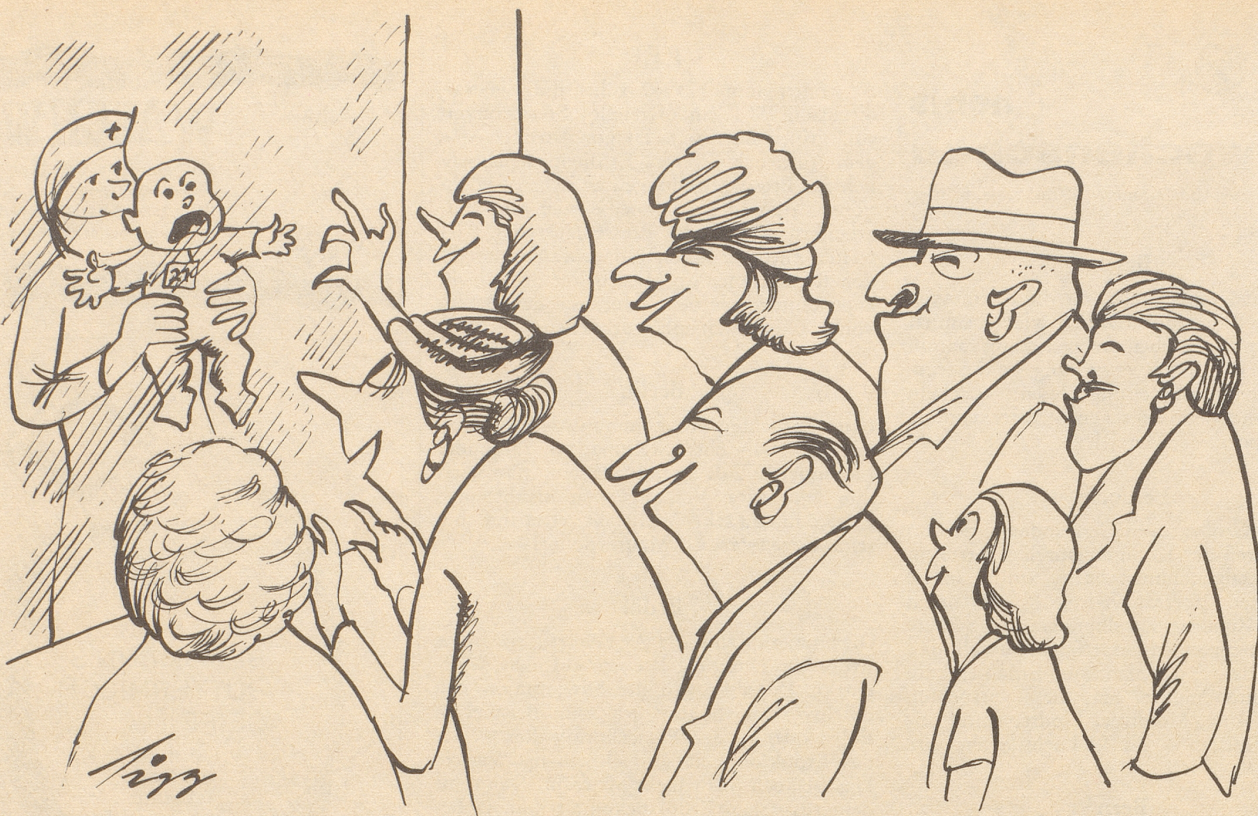
Junger Mensch macht erste Bekanntschaft mit Verwandtschaft