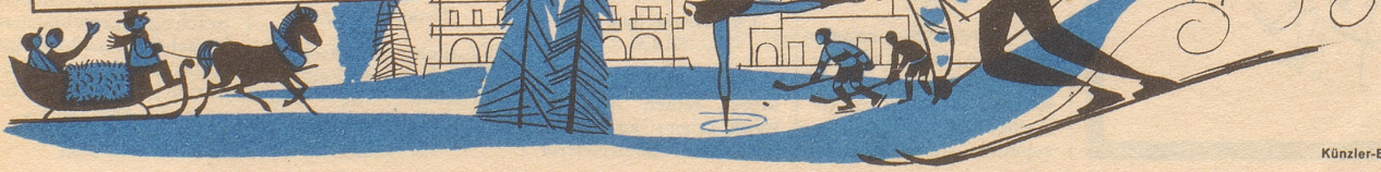
Künzler-Bachmann-Reklame, St. Gallen