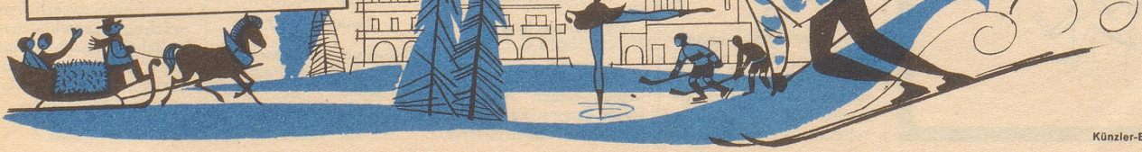
Künzler-Bachmann-Reklame, St. Gallen