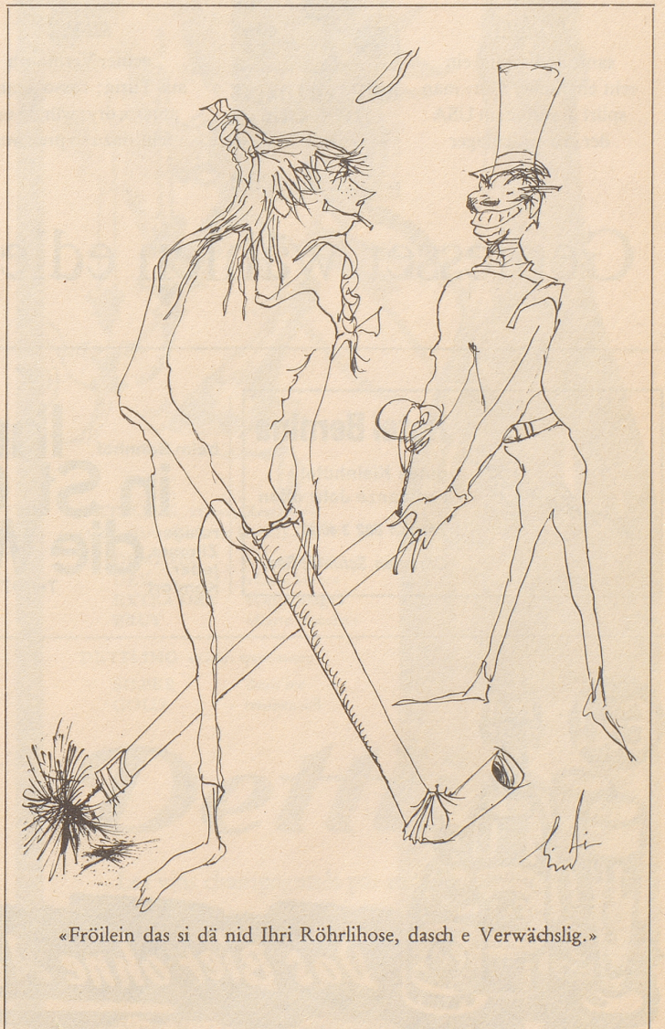
«Fröilein das si dä nid Ihri Röhrlirose, dasch e Verwächslig.»