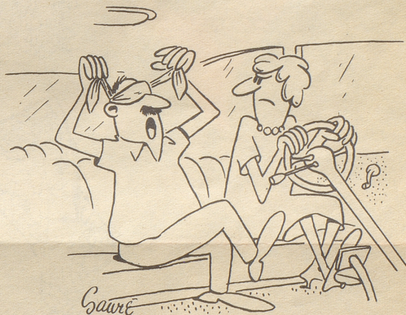
«So, ich bi parad, fahr los!»

in der Kinopause zu Salamireklame, Quartiergeklatsch, Bodenwichseanpreisungen und Schokoladenschmatzen einfach unerträglich! Wenn Gershwin im Künstlerhimmel gehört hat, wie ein sonst ruhiges und würdiges Kinopublikum sich benahm – ich bin sicher, daß er dann geschmunzelt hat! Gibt es doch, wie mir scheint, nicht leicht ein schöneres Kompliment für einen Komponisten als der Ruf des Kinopublikums, seine Werke als Pausenmusik abzusetzen!