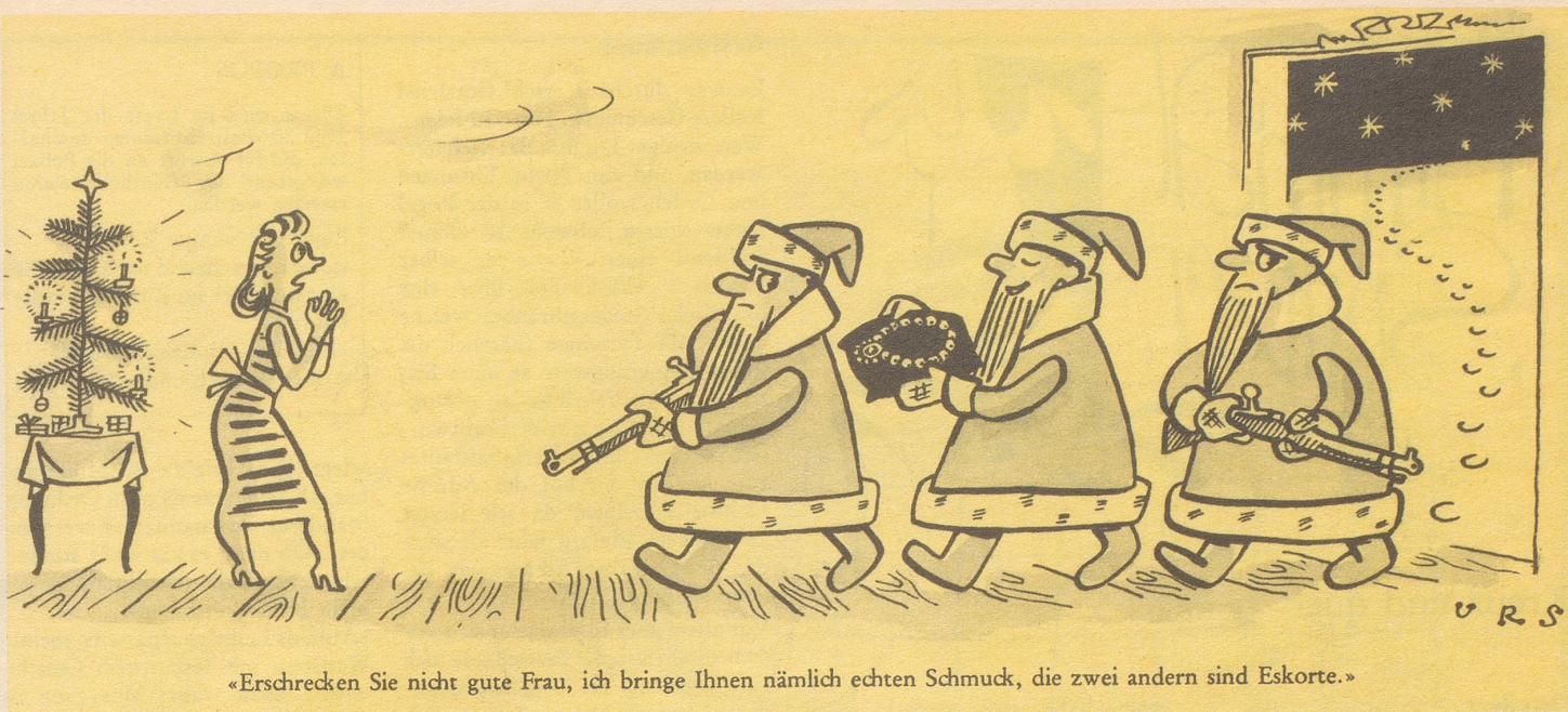
«Erschrecken Sie nicht gute Frau, ich bringe Ihnen nämlich echten Schmuck, die zwei andern sind Eskorte.»