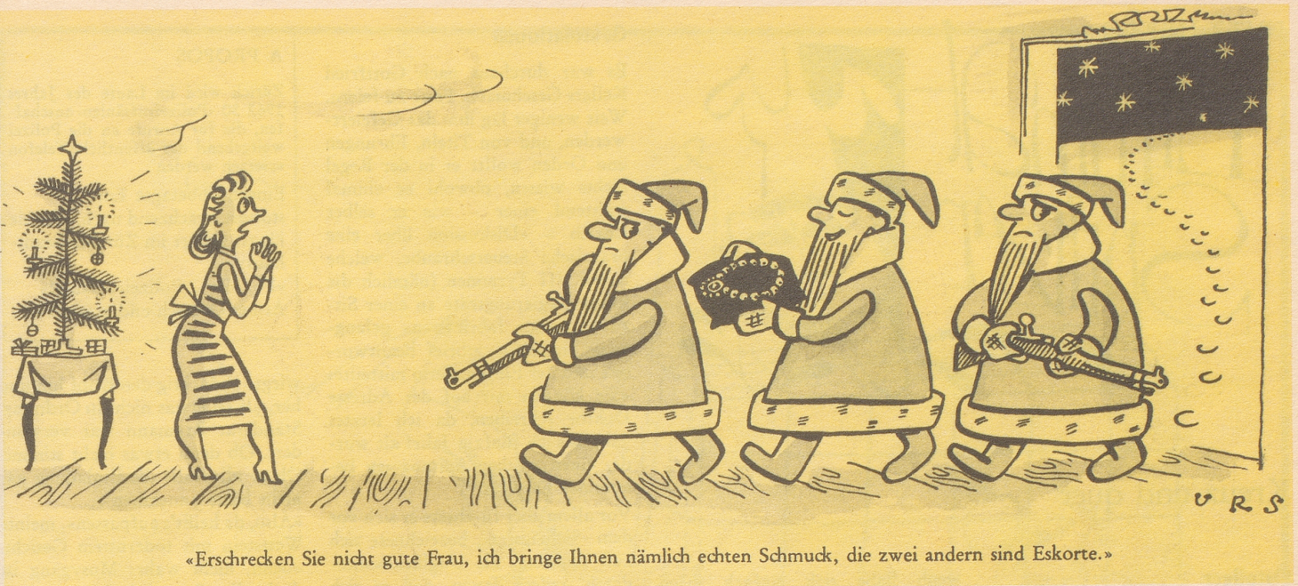
«Erschrecken Sie nicht gute Frau, ich bringe Ihnen nämlich echten Schmuck, die zwei andern sind Eskorte.»