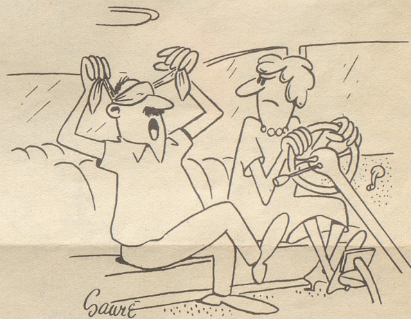
«So, ich bi parad, fahr los!»

in der Kinopause zu Salamireklame, Quartiergeklatsch, Bodenwichseanpreisungen und Schokoladenschmatzen einfach unerträglich! Wenn Gershwin im Künstlerhimmel gehört hat, wie ein sonst ruhiges und würdiges Kinopublikum sich benahm – ich bin sicher, daß er dann geschmunzelt hat! Gibt es doch, wie mir scheint, nicht leicht ein schöneres Kompliment für einen Komponisten als der Ruf des Kinopublikums, seine Werke als Pausenmusik abzusetzen!